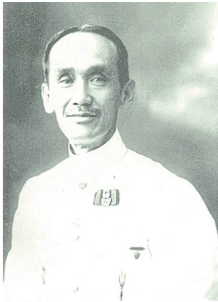
พระยาศรีเทพ (เส็ง วิริยศิริ)