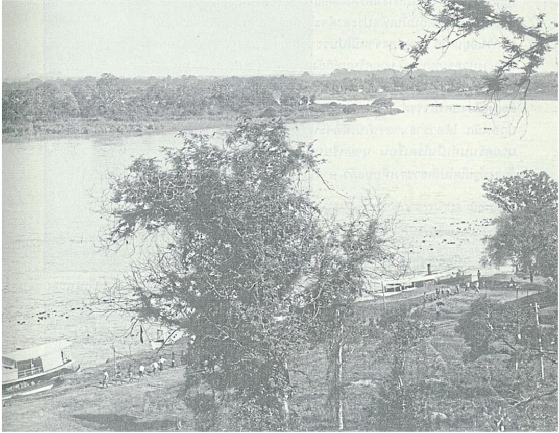
แม่น้ำเจ้าพระยาไหลผ่านเขารธรรมามูล เมืองชัยนาท